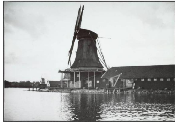
21.05694 De Kogmeeuw of Schijjtjager 1900