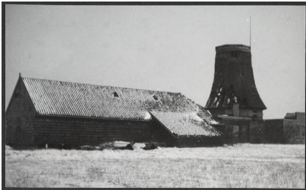
21.06179 De Zaadzaier of Lastdrager 1917