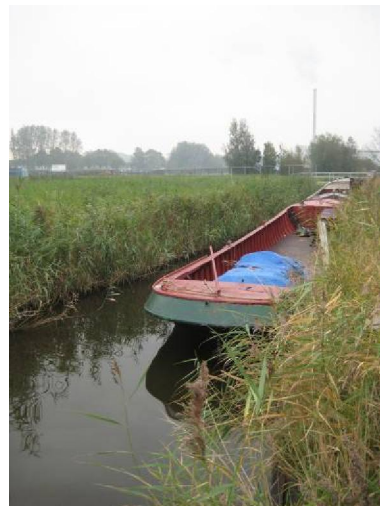
Dwarssloot bij molen de Zaadzaaijer