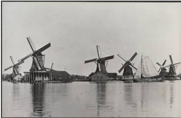
21.07278 Beeld van de Hemmes rond 1900

In de eerste helft van de 20 e eeuw maakten de molens plaats voor industrie. Na de oorlog bleef het terrein zijn industriële functie behouden maar de industrie zelf verdween geleidelijk. Op de westpunt is nu nog de scheepswerf en het scheepsmotoren bedrijf van Kramer aanwezig, het enige grote bedrijf. Tegen het Kalf aan staan wat kleinere loodsen en bedrijven. De rest van het terrein is leeg en bedekt met zand. Hierdoor zijn de oude sloten vrijwel allemaal verdwenen. Alleen de kleine, noord-zuid lopende dwarsslot naar de plek waar vroeger molen de Zaadzaier stond, is nog aanwezig. De ontsluitingsweg 't Kalf in de lengte van de Hemmes ligt ongeveer op de plaats waar de grote oost-west lopende sloot lag. De zuidoostoever is door aanplemping en het slaan van zware beschoeiingen recht getrokken. De rest van het eiland heeft zijn onregelmatige oevers grotendeels behouden.