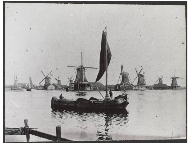
21.07248 Beeld van de Hemmes rond 1900