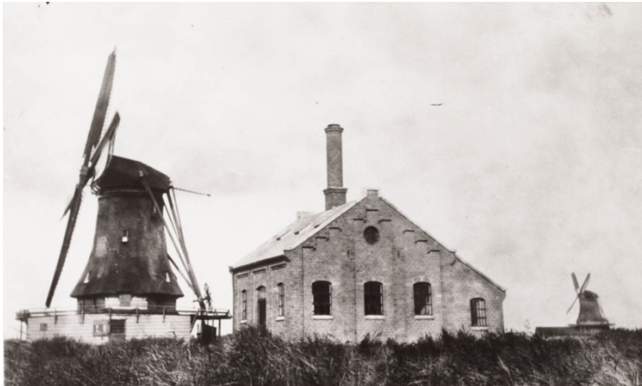
Oliemolen De Zon en fabriek Jacob Vis (GAZ 21.21011)