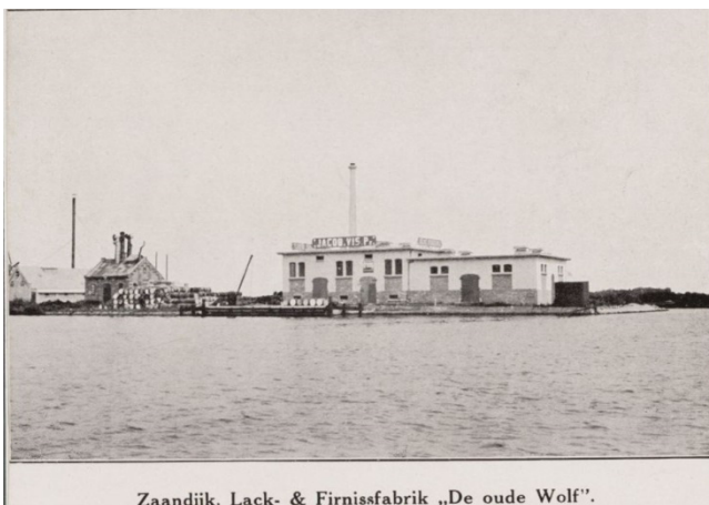
Zandijk. Lack- & Firnisfabrik „De oude Wolf”.

De fabriek werd direct herbouwd, maar ging in 1912 wederom deels in vlammen op. In de jaren erna werd de fabriek weer herbouwd en breidde uit. In 1929 werd een nieuwe blekerij gebouwd en vlak daarna werd de lakstokerij vernieuwd, een laboratorium aan het bedrijf toegevoegd, buitentanks geplaatst en de magazijnen vergroot. Zo was in korte tijd het buitendijkse gebiedje volgebouwd met fabrieken en bijgebouwen. Dit is zeer kenmerkend voor bebouwing op de hemmen langs de Zaan. In de periode van de industrialisatie in Nederland werden namelijk vooral deze hemmen gebruikt om fabrieken op te bouwen.