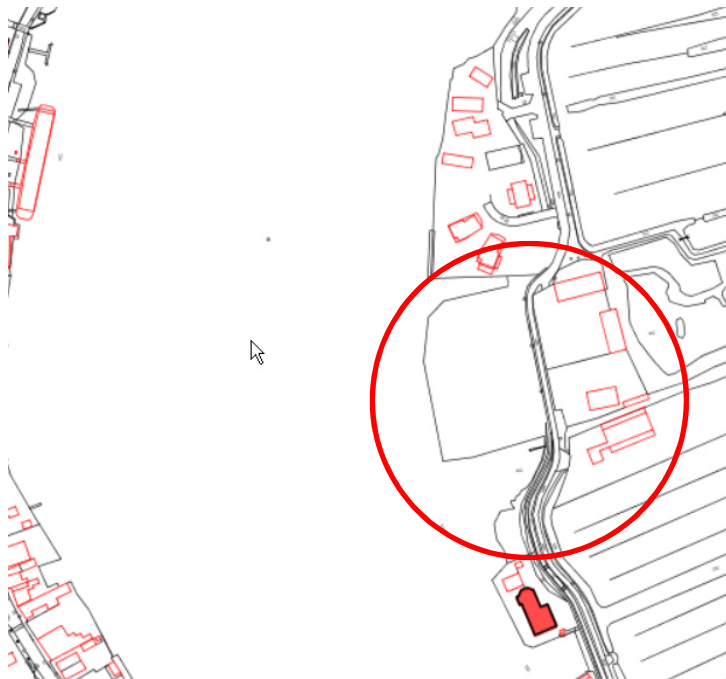
Kaart met Jacob Vis terrein rood omcirkeld (GIZ)

Het Jacob Visterreingelegen ligt direct ten noorden van de Zaanse Schans aan de oever van de Zaan en wordt aan drie zijden omringd door water. Aan de oostzijde wordt het terrein begrenst door de Kalverringdijk.