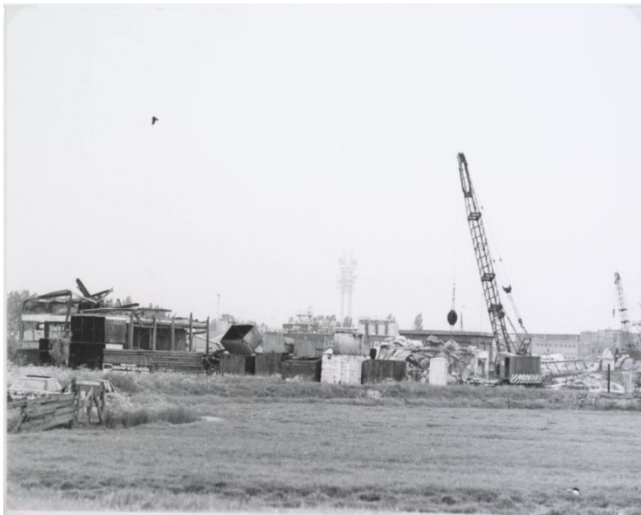
Sloop Jacob Vis 1990 22.10332

In 1990 volgt de sloop van de fabrieken.