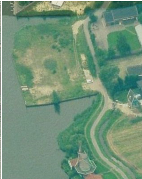
Terrein vogelvlucht 2016