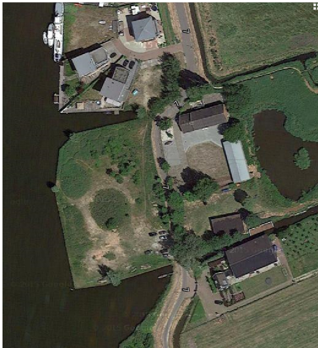
Terrein 2016

Het terrein ligt op dit moment braak. De oevers zijn rechtgetrokken, zoals ten tijde van de fabriek Jacob Vis, er staat geen bebouwing en er is amper begroeiing. Wel is het terrein nog steeds aan drie kanten omringt door water. Op dit moment heeft het terrein een bedrijfsbestemming. Ten noorden van het plangebied is een enclave van vrijstaande woningen op een hem gerealiseerd. De Kalverpolder ten oosten van het terrein is beschermd als nature 2000 gebied en in 2006 is de Stichting Kalverpolder opgericht met als doelstelling de instandhouding van natuur- en landschappelijke waarden van de Kalverpolder en de Enge Wormer. De Zaanse Schans ten zuiden van het terrein is uitgereid tot een toeristische trekpleister met jaarlijks 1,9 miljoen bezoekers.