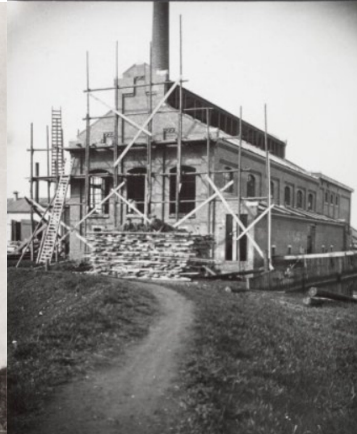
Bouw fabriek, 1900 (GAZ 21.21022)