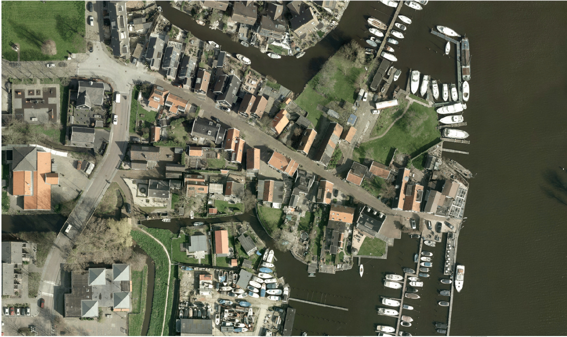
14. Historische dorpskern