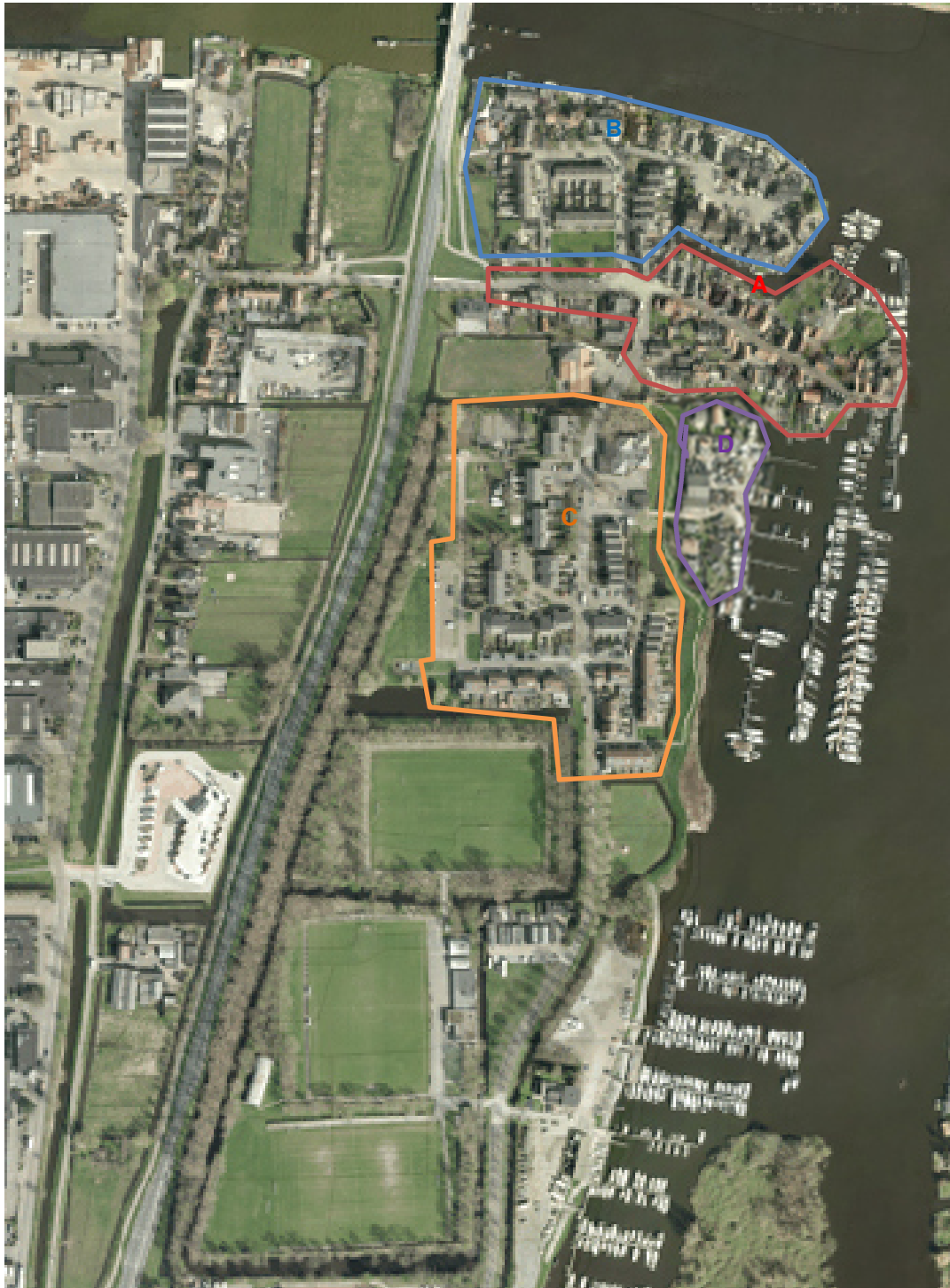
13. Oorspronkelijke dorp (A) en de verschillende uitbreidingen van de jaren in chronologische volgorde.