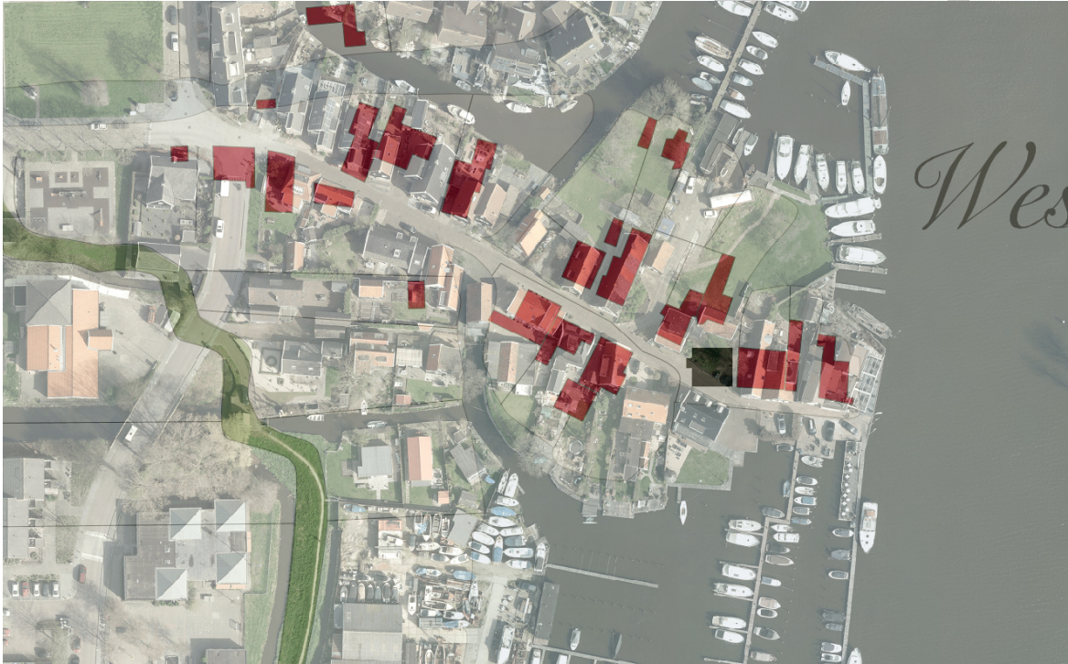
15. Bebouwing met mogelijk cultuurhistorische waarden