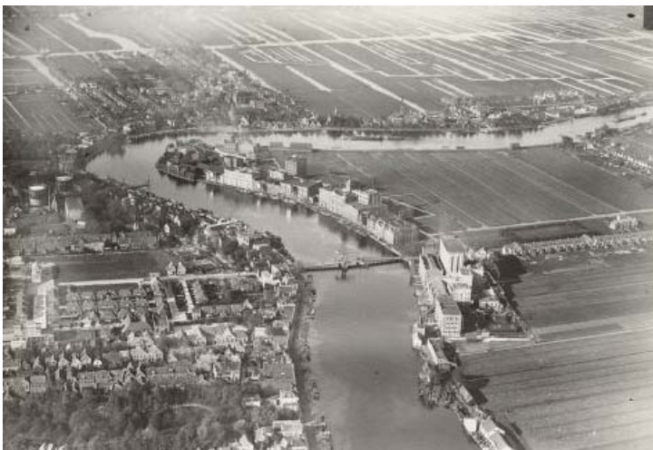
Figuur 2: Luchtfoto Wormerveer en Wormer, begin 20 e eeuw, waarin te zien is dat Wormer meer landinwaarts ligt.