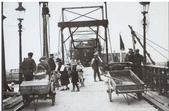
Figuur 6: Bouw van het beweegbare gedeelte van de Zaanbrug: 1926. GAZ

de Wormerveerse gemeenteraad, waar hij ook deel van uitmaakte. Hij stelde daarbij uit eigen middelen een bedrag van fl. 2000,- in het vooruitzicht als beginkapitaal. De gemeenteraad ging akkoord met het plan en een jaar later al, in 1889, kon de Zaanbrug met feestelijk vertoon officieel in gebruik worden genomen. Tegelijk werd aan de Wormer kant, in het verlengde van de brug het Wormer Laantje (later bekend als Nieuweweg) de wegverbinding Zaanbrug – Zandweg, in gebruik genomen, waarvan de aanleg geheel bekostigd was door de gemeente Wormerveer.