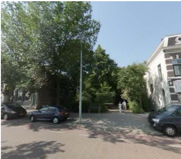
Figuur 10: Ingang van het Wilhelminapark 2010

Zaanweg 19-20 Wormerveer, houten kaaspakhuis 'Gouda' – provinciaal monument 1900