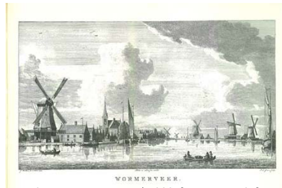
Fig 8: Wormerveer, rond 1800. [Loosjes, 1794]