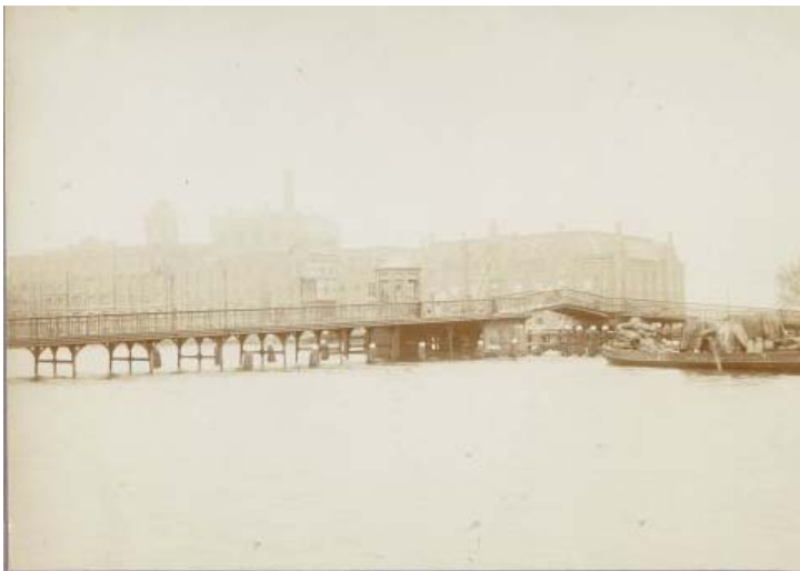
Figuur 1: Eerste aanleg Zaanbrug, omstreek 1900 GAZ