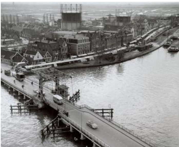
Figuur 4: Luchtfoto omstreeks jaren 30. Uitzicht op de kantoorvilla's aan de Zaanweg.

De naam Wormerveer komt voort uit het Noorder- of Wormerveer dat ongeveer 600 jaar heeft bestaan. Dit veer verbond het Noordeinde met de Zandweg in Wormer, en werd ook wel Zaanderveer genoemd.