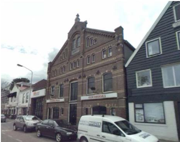
Figuur 9: Houten Zaadpakhuis Amsterdam, rijksmonument

Op de mogelijk nieuwe plek van de brug zijn ook een aantal karakteristieke elementen aanwezig. Hieronder een korte beschrijving en waardestelling.