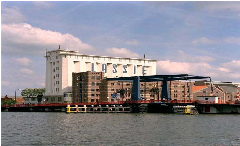
Figuur 12: Deel van de Zaanwand en de Zaanbrug, 2006 (Verhoek)