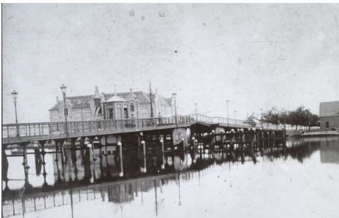
Figuur 3: De Zaanbrug omstreeks 1900.