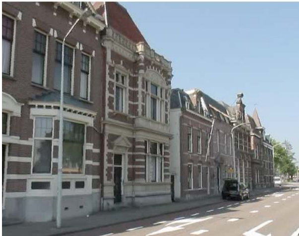
Figuur 11: De villa's aan de Zaanweg in Wormerveer, bijna zonder uitzondering rijksmonumenten.