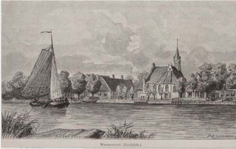
Fig 13: Gezicht op de Nederlandse Hervormde Kerk te Wormerveer, 1850.

De huidige locatie van de Zaanbrug past in de ontwikkelingsgeschiedenis van de brug. De gehele (historische) infrastructuur van beide dorpen is gericht op de huidige Zaanbrug. Verwijdering van de brug zal een diep gat slaan in beide dorpen en het historische wegennet zwaar aantasten. Opvulling van de aldus ontstane gaten met nieuwbouw die goed past bij de omringende fabrieken, pakhuizen en andere bebouwing zal een zware opgave zijn. Bij handhaving van de brug op deze plaats blijft het historische beeld in stand en blijft de geschiedenis van dit deel van de Zaan herkenbaar als onderlegger voor nieuwe ontwikkelingen.