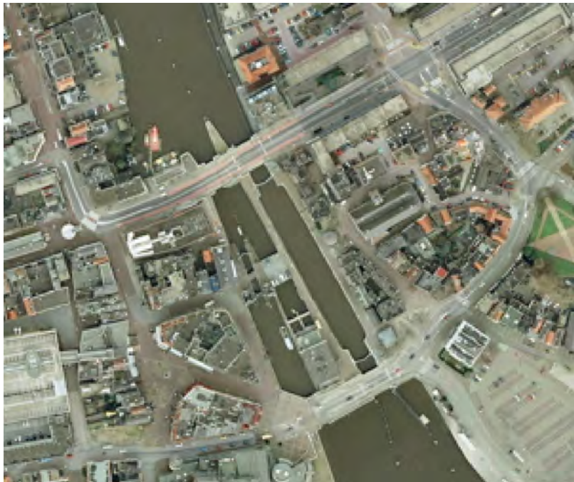
1 het sluiscomplex in 2007.

In het verleden heeft de dam een veelheid aan functies en betekenissen gehad voor de regio en de stad. Dat maakt ingrijpen in deze plek tot een spannende opgave, waarbij allerlei waarden en verhalen uit het verleden zorgen voor beperkingen en kansen om deze bijzondere 'knoop' in Zaandam tot een goed functionerende, prettige en betekenisvolle plaats te maken.