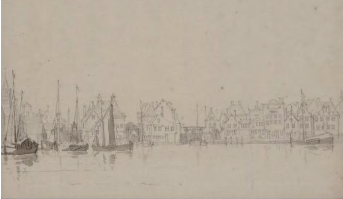
6 Tekening van de Grote Sluis, de Duikersluis en de Kleine Sluis in 1790. Beeldbank GAZ, nr. 11.0299

De Grote Sluis werd snel te klein door de steeds grotere schepen die de sluis moesten passeren. Daarom werd in 1608 een overtoom aangelegd; een lager dijkgedeelte, waarover de schepen werden gesleept ('gewonden') om de Dam te passeren. Tot 1718 is deze overtoom in gebruik gebleven. In die tijd waren de meeste scheepsbouwers naar de Voorzaan verhuisd en liep de scheepsbouw terug, waardoor minder schepen de Dam passeerden. In totaal zijn waarschijnlijk meer dan 1000 schepen over de overtoom gehaald in de 109 jaar dat deze in gebruik was. 6