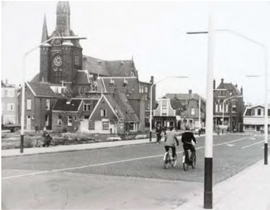
9 De nieuwe Peperstraat, 1960. GAZ, fotonummer 22.10811.