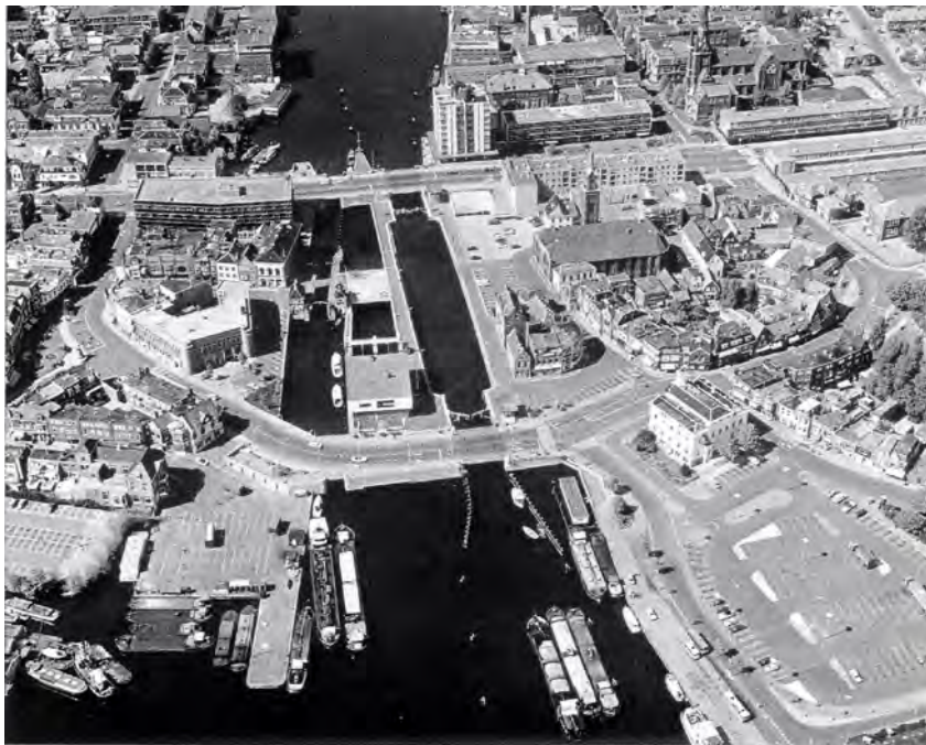
10 Het sluiscomplex omstreeks 1975.