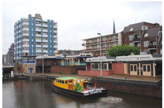
Foto's van links naar rechts, van boven naar beneden: 19 de Grote Sluis met sluiswachterswoning en accijnshuisje. 20 het Zaangemaal gezien vanaf de Wilhelminakade 21 de historische bebouwing aan de Dam, de voormalige Hogendam 22 de Wilhelminasluis met erachter de bebouwing aan de aan de Oostkade en Peperstraat