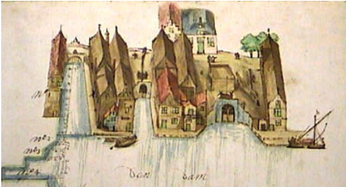
4 Tekening van het oostelijk deel van de dam door Johan Heymenbergh, 1684.