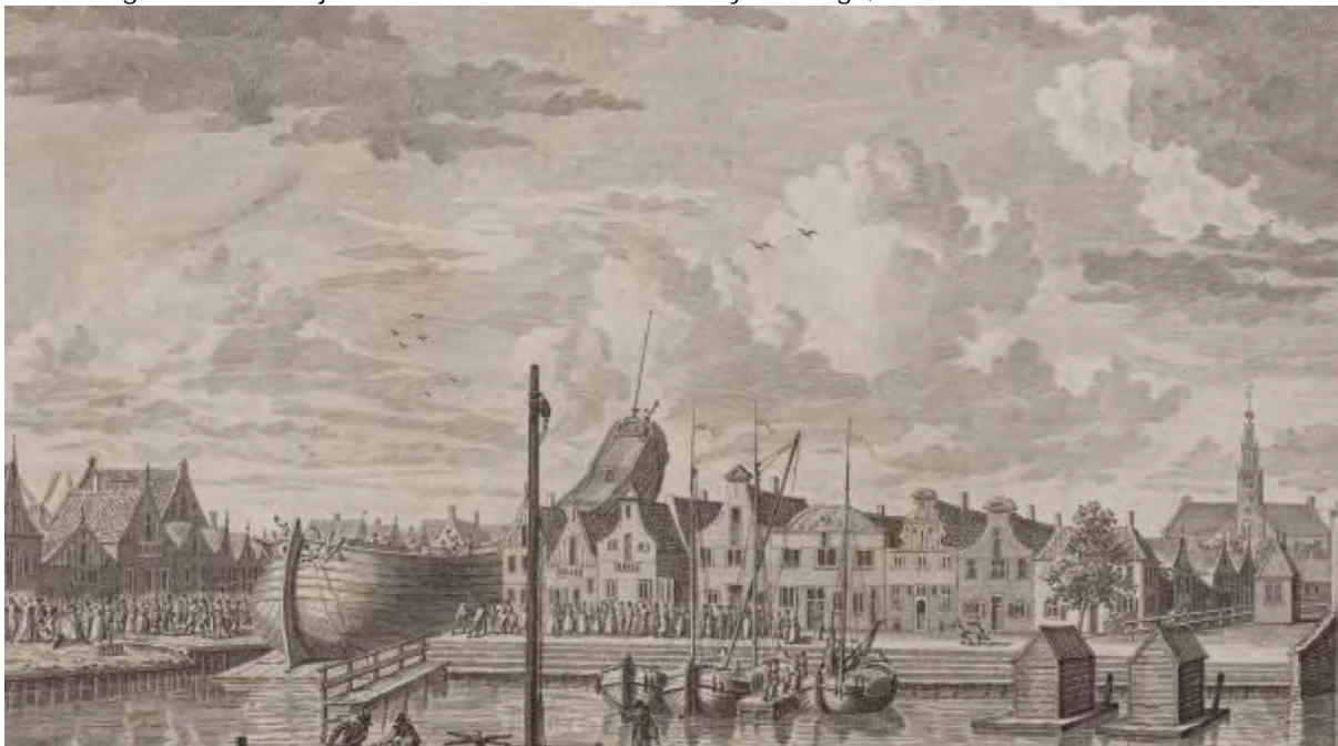
5 De overtoom in 1717 door J. Bulthuis, naar een schilderij van wed. M. van Gijzen. Beeldbank GAZ, nr. 11.2170.