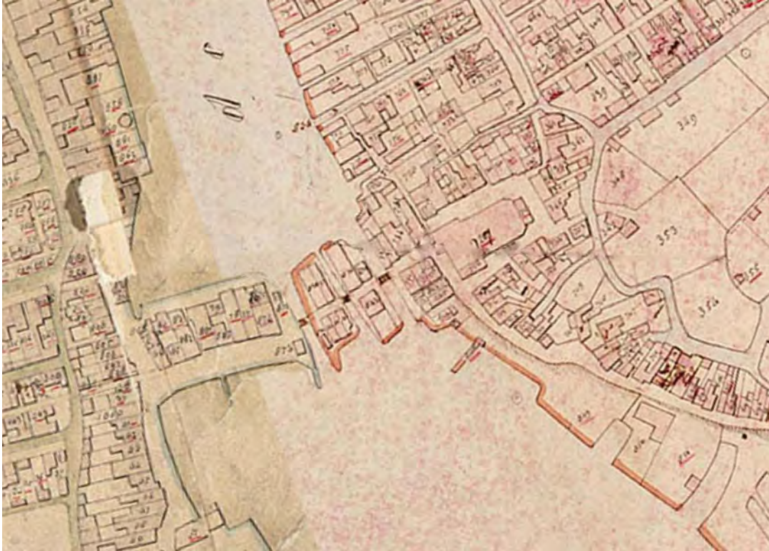
3 De oost- en Westzijde van de Zaan op de kadastrale minuutplannen uit 1810. Bewerking: Lion Charmant