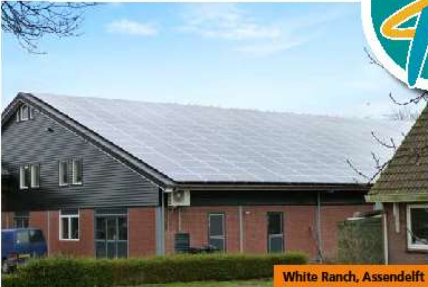
White Ranch, Assendelft