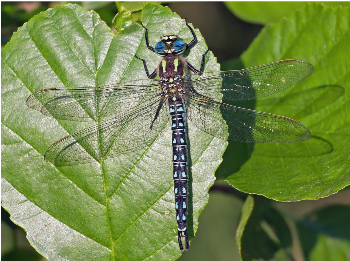
Kleine Glazenmaker: Door Christian Fischer, CC BY-SA 3.0, https://commons.wikimedia.org/w/index.php?curid=33099755

Met het puntensysteem wordt beoogd de leefomgeving van een aantal doelsoorten (flora en fauna) te verbeteren en/of uit te breiden. De meeste van deze doelsoorten worden gemonitord in het Meetnet biodiversiteit, waardoor zicht ontstaat op hoe het deze soorten vergaat in Zaanstad. Ook overlappen de doelsoorten grotendeels met de soorten die elke 5 jaar in kaart gebracht worden met een ecologische gebiedenkaart. Deze kaart geeft een goede indicatie van de biodiversiteit in de bebouwde omgeving, in de groengebieden en rondom het water. In de doelsoortencatalogus is te zien welke doelsoorten profiteren van de verschillende maatregelen. Voor elk doelsoort is uitgewerkt welke maatregelen ervoor nodig zijn om deze soort een volwaardige leefomgeving te bieden. De initiatiefnemer van het project kiest zelf welke doelsoorten hij/zij wil faciliteren in het project, eventueel met advies van de gemeente of een ecologisch adviesbureau.