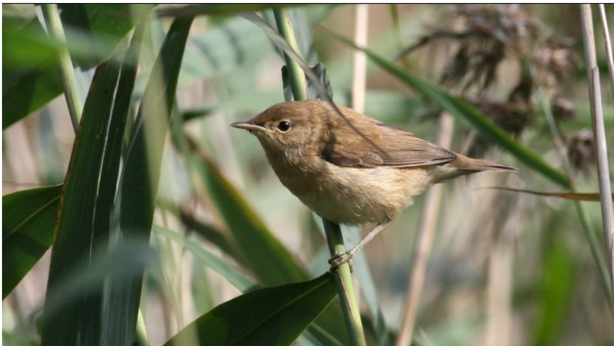
Kleine Karekiet.

Bij tijdelijke projecten wordt in afstemming met het team Ecologie bepaald hoe natuurinclusieve maatregelen in het project doelmatig kunnen worden ingepast.