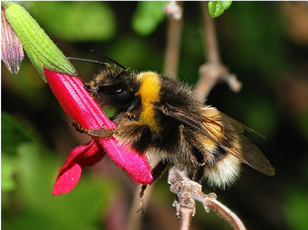
Hommel: Door Alvesgaspar - Eigen werk, CC BY-SA 3.0, https://commons.wikimedia.org/w/index.php?curid=2931141

Ook maatregelen die niet in het puntensysteem staan kunnen worden toegepast. In dat geval wordt in overleg bepaald hoeveel punten hiermee behaald worden. Hiertoe is in elke categorie maatregelen de mogelijkheid van een 'eigen initiatief' opgenomen.