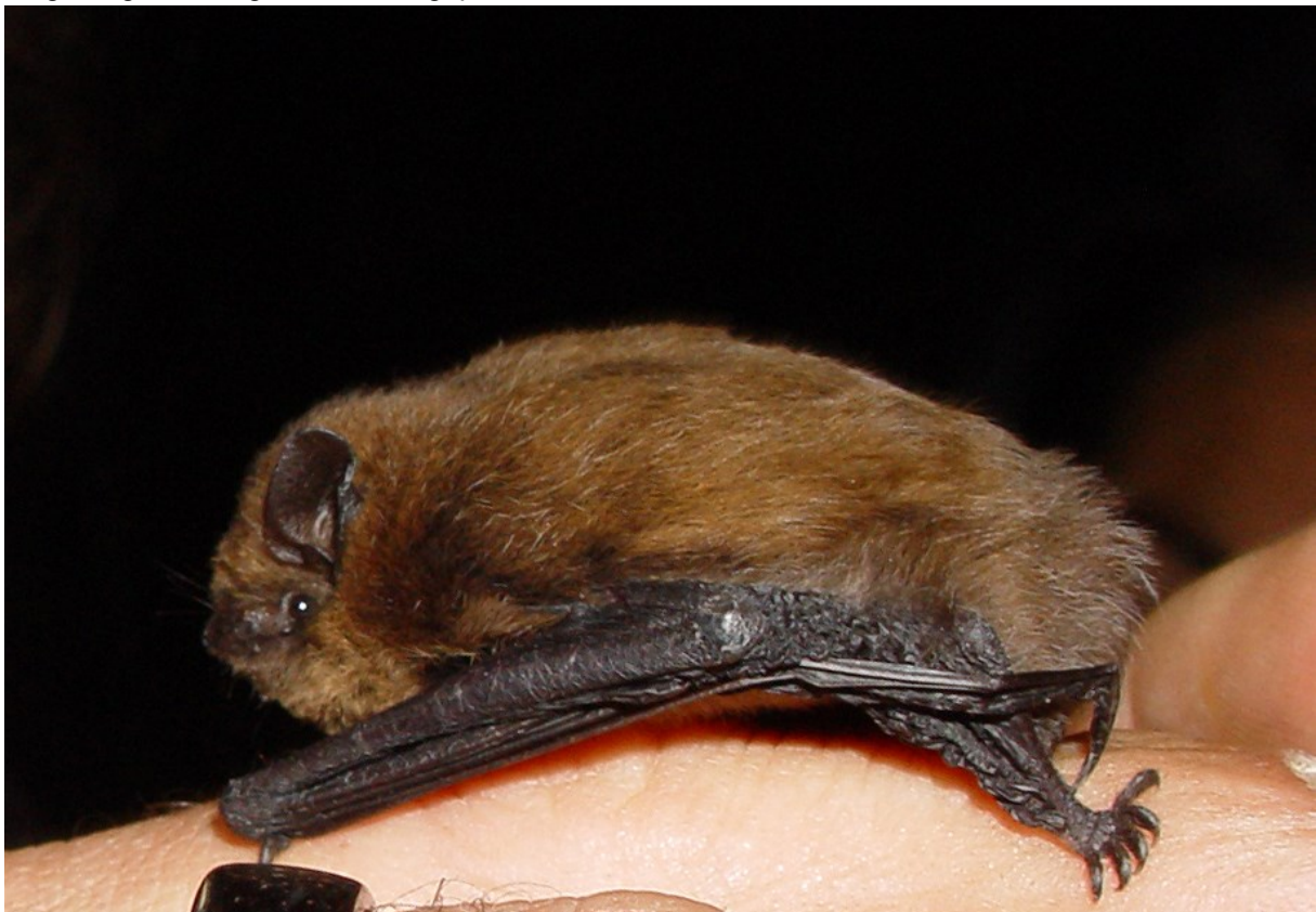
Gewone dwergvleermuis

Ook bij renovaties kan bestaand leefgebied verloren gaan, en/of liggen er kansen om de locatie meer natuurinclusief te maken. Bij renovaties zijn sommige maatregelen die bij nieuwbouw goed te realiseren zijn, erg ingewikkeld, ingrijpend en/of duur. Er is daarom gekozen om het benodigde puntenaantal te halveren. Betreft het een renovatie van een monument, dan wordt het puntenaantal voor verblijven nogmaals gehalveerd en hoeven er geen punten te worden behaald met gebouwmaatregelen. De monumentale status is van historisch belang en natuur-inclusieve toepassingen kunnen deze waarde aantasten. De natuurinclusieve maatregelen moeten daarom zorgvuldig worden gekozen en ingepast.