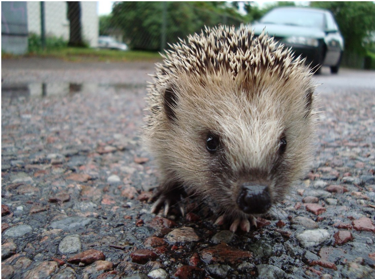
Egel. Door Calle Eklund/V-wolf - Eigen werk, CC BY-SA 3.0, https://commons.wikimedia.org/w/index.php?curid=11009506

In het puntensysteem wordt op basis van projectgrootte een verzoek gedaan om een aantal volwaardige leefomgevingen voor plant- of diersoorten te creëren. Net als in het convenant vraagt het puntensysteem 1 volwaardige leefomgeving bij een klein project, 2 bij een middelgroot project en 3 bij een groot project. Het puntensysteem werkt daarbij nader uit wat zo'n volwaardige leefomgeving inhoudt, en helpt daarmee de ontwikkelaar om de maatregelen goed op elkaar af te stemmen en daadwerkelijk een volwaardige leefomgeving te creëren. Overeenkomstig het convenant wordt er bij elk project gevraagd om minimaal een volwaardige leefomgeving voor een gebouwgebonden soort te realiseren. Daarnaast is er vrije keuze uit 4 andere categorieën, namelijk boombewonende soorten, aan struweel gebonden soorten, aan bloemrijk grasland gebonden soorten en aan water of oevers gebonden soorten. De initiatiefnemer maakt deze keuze zelf, eventueel op basis van ecologisch advies van de gemeente of een ecologisch adviseur. De keuze kan afhangen van de aard en locatie van het project en van welke soorten al in de buurt van het project aanwezig zijn.