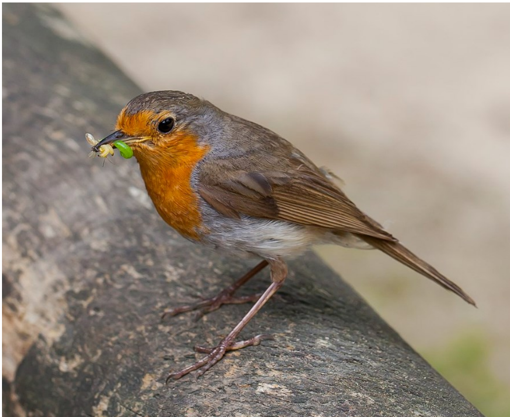
Roodborstje: Door Diego Delso - Eigen werk, CC BY-SA 3.0, https://commons.wikimedia.org/w/index.php?curid=21655419

Het puntensysteem wordt vastgesteld door het college en vervolgens gepubliceerd. Gezien het vrijwillige karakter is een nadere overgangsbepaling niet van toepassing en is het direct toepasbaar. Bij projecten waarvan de concept-antérieure overeenkomst in een gevorderde fase verkeert, wordt in gezamenlijkheid bepaald welke toepassing van het puntensysteem haalbaar en billijk is.