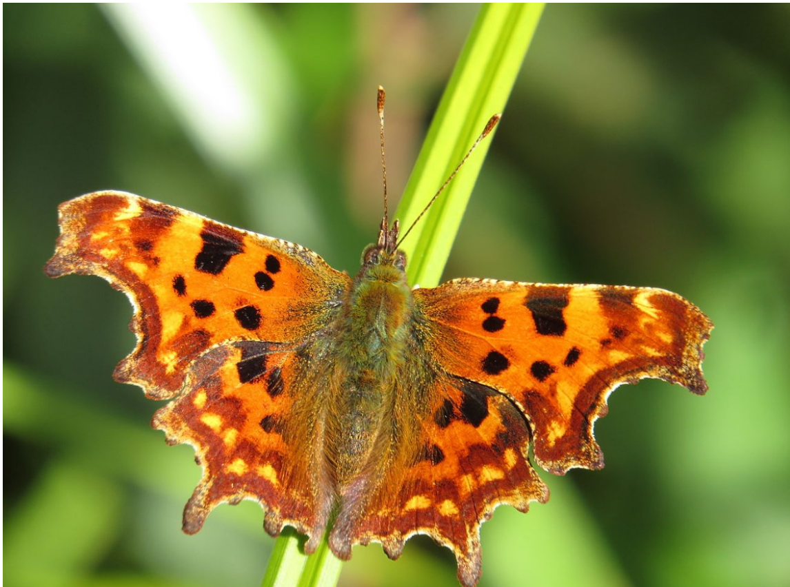
Gehackelde Aurelia.

Zowel het in 2018 vastgestelde Zaanse Groen- en Waterplan (GWP), de in 2021 vastgestelde uitvoeringsagenda klimaatadaptatie als in de in 2021 ondertekende intentieovereenkomst Klimaatbestendige Nieuwbouw in de MRA en Noord-Holland (hierna: convenant) hebben als belangrijkste doelen het vergroten van de biodiversiteit en het werken aan klimaatadaptatie. Natuur-inclusief bouwen is een van de instrumenten die hier concreet invulling aan geven.